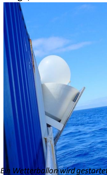
Ein Wetterballon wird gestartet

Mit Grüßen aus dem Südatlantik, Johannes Karstensen für die Fahrtteilnehmer M124